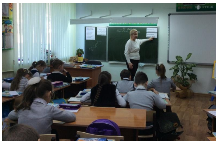
Урок математики во 3 классе.