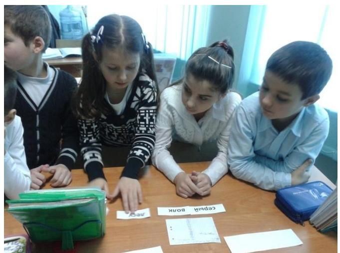
Урок русского языка во 2 классе.