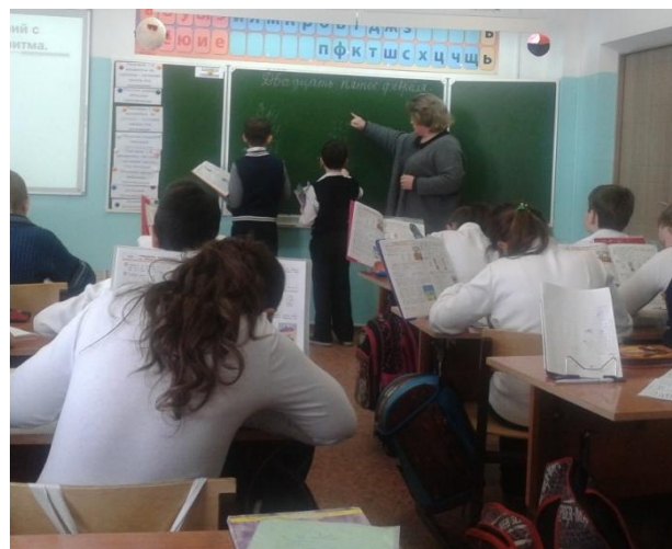
Урок математики в 4 классе.