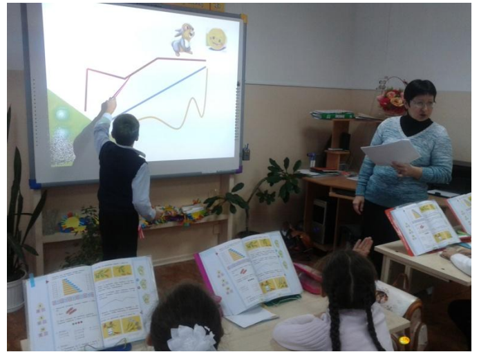
Урок математики в 1 классе.