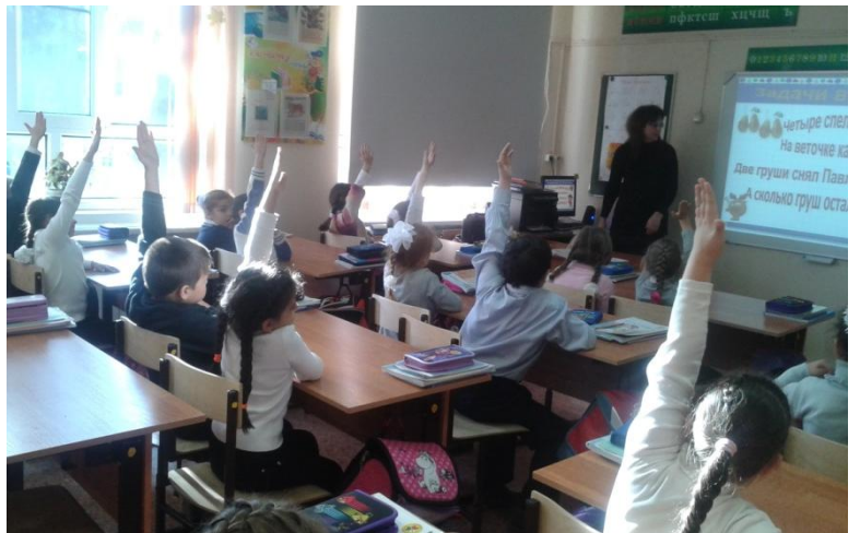
Урок математики в 1 классе.